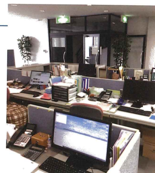
◀暗く重たい 雰囲気