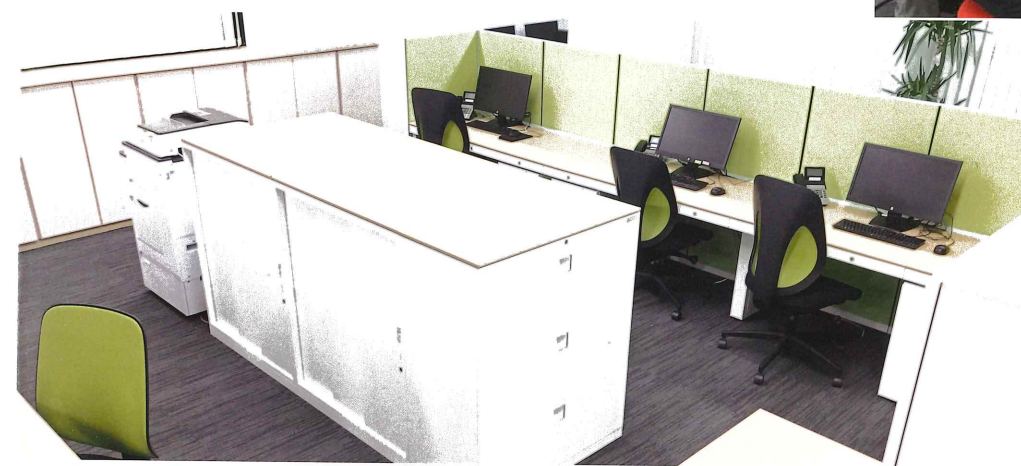
◀固定席の中央にマルチスペース