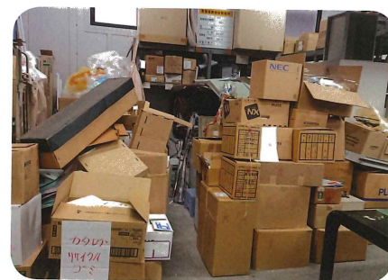
▲ペーパーレス化で廃棄した書類の山 1.3t